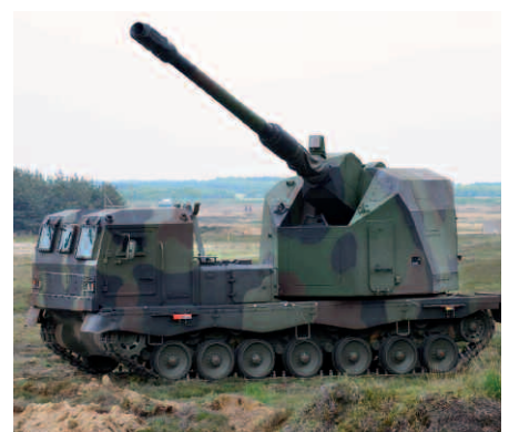
Das DONAR-Geschütz kommt von der grossen deutschen Waffenschmiede Krauss-Maffei-Wegmann (KMW) in München. Das Fahrgestell hingegen wurde von General Dynamics European Land Systems (GD ELS) entwickelt.