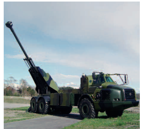
Schweden: Archer. Kaliber 155 mm. Rohrlänge 52 Kaliber. Gefechtsgewicht 34 t. Schussdistanz 50 km. Feuerschlag 3 Schuss in 13 Sekunden. Wirkungsbereich je 85 Grad. Munitionsvorrat 21 Geschosse. Bedienung drei Mann.