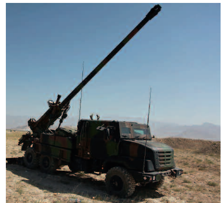
Frankreich: CAESAR (Camion Equipé d'un Système d'Artillerie). Kaliber 155 mm. Rohrlänge 52 Kaliber. Gewicht 18 t. Distanz 55 km. 6 Schuss/min. Wirkungsbereich je 17 Grad. Munitionsvorrat 18 Geschosse. Bedienung vier Mann.