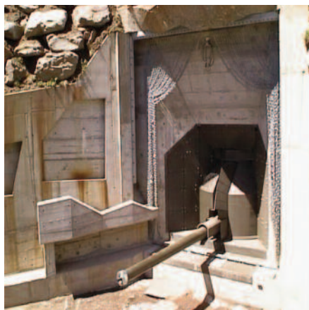
15,5 cm Festungskanone «BISON».

benutzbaren permanenten Sperrstellen so rasch als möglich stillzulegen seien.