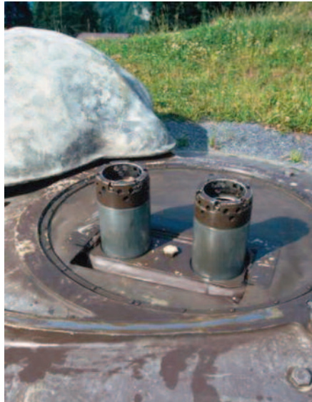
Schussbereiter 12 cm Festungsminenwerfer (Zwillingsgeschütz).

Die Festungsminenwerferbunker befinden sich entlang der «Passages obligées». Sie wurden für den Kampf um Sperrstellen errichtet. Im Raumsicherungs- bzw. Verteidigungsfall dienen sie der unmittelbaren Feuerunterstützung der Kampfverbände. Wenn die geographische Lage eines Bunkers dies erlaubt hat, konnte dieser auch für den allgemeinen Feuerkampf eingesetzt werden. Das Feuer der «BISON» Feuereinheiten war für den Feuerkampf auf Schlüsselstellen der Alpentransversalen vorgesehen. Die Anlagen wären besetzt worden, wenn die Alpentransversalen im