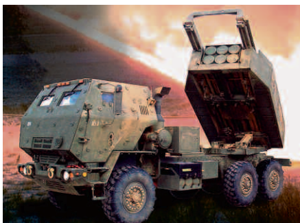
US-Artillerie: HIMARS von Lockheed. High Mobility Artillery Rocket System.