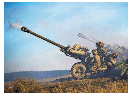
GB: Light Gun, 105 mm, Exportschlager, 8 Schuss/Minute, 20 km, hier ungetarnt.