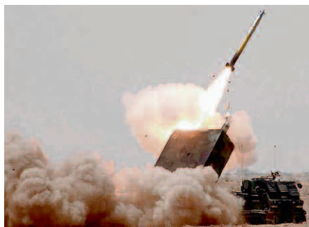
GB-Artillerie: GMRLS, 227 mm, 70 km. Guided Multiple Launch Rocket System.