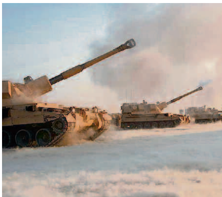
GB-Artillerie: Die Pz Hb AS-90, 155 mm.

Grundsätzlich legte Wellinger, selber ein Artillerist, ein überzeugendes Bekenntnis zur Artillerie ab: «Jede Armee braucht