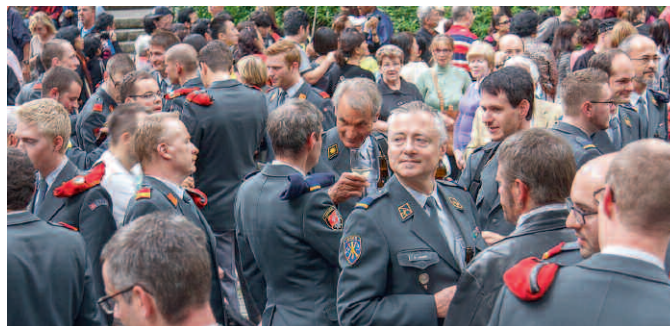
Der Schulterschluss ist vollzogen: Artillerie und Luftwaffe.